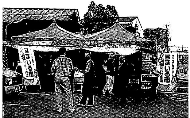
「すまいる市」駅前店の風景

いる券は買物500円毎に5%利用できます。今回、新たな環境発信として買物袋の持参運動を展開しています(買物1,000円毎に1ポイントを進呈し、30ポイントですまいる券1冊(1,100円分)と交換)。もちろん、生産地の近距離化、安心、安全をモットーにした品揃えて、顔写真や商品づくりのこだわりも明記しています。