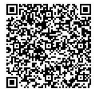
申し込みフォーム QRコード

問合せ・申込先 気候ネットワーク京都事務所 〒604-8124 京都市中京区帯屋町574番地 高倉ビル305 TEL:075-254-1011 FAX:075-254-1012 Mail:kyoto@kiconet.org