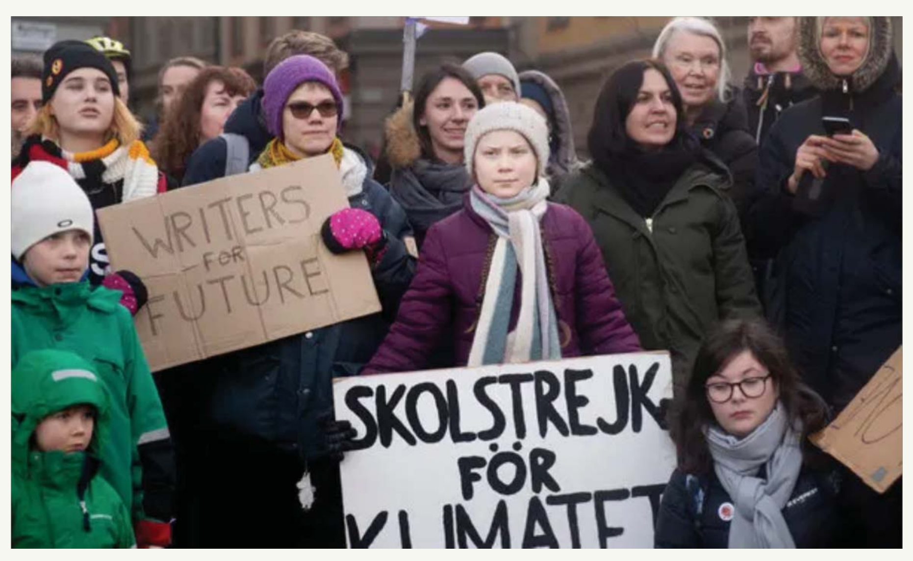
The NewYork Times