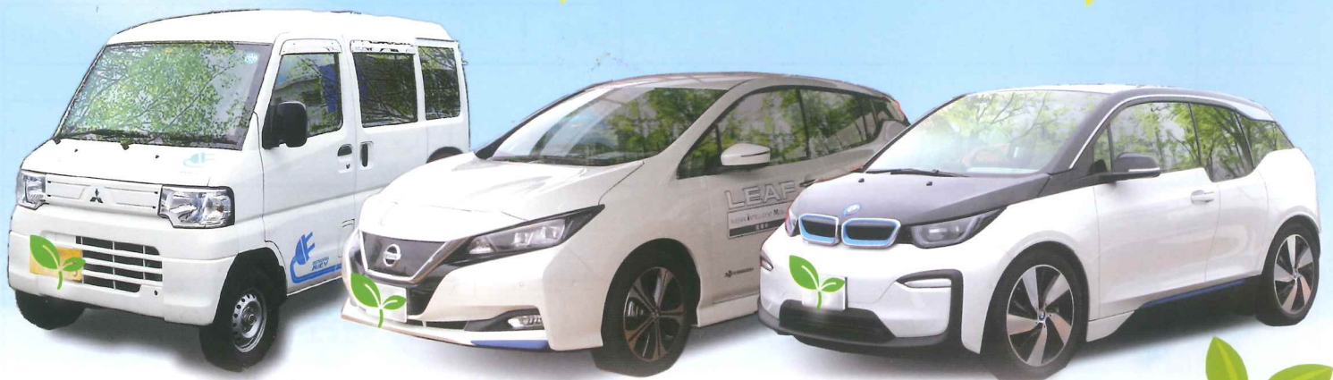
三菱 ミニキャブミーブ