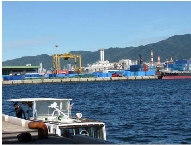
50ミリ普通レンズで六甲アイランド北公園から撮影したもの。