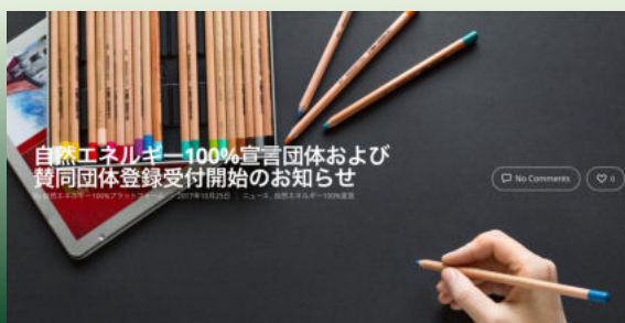
自然エネルギー100%宣言団体および 賛同団体登録受付開始 (2017. 10. 25)