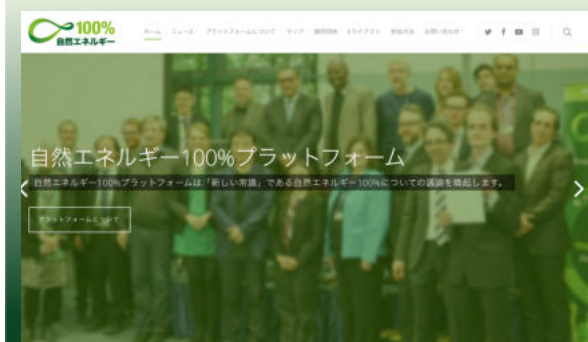
日本版プラットフォームWebサイト オープン (2017. 9. 7)