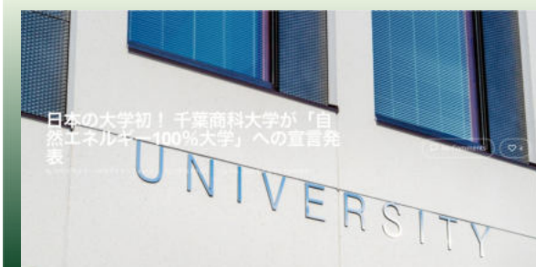
日本初！千葉商科大学が「自然エネ ルギー100%大学」への宣言発表 (2017. 11. 13 記事)