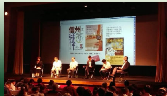
強くてしなやかな上田のつくり方 (2019. 7. 5 イベント)