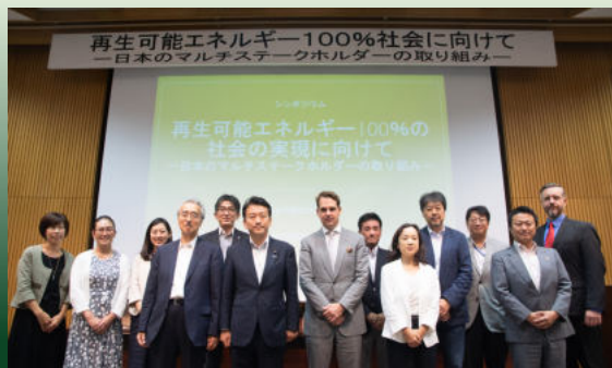
再エネ100%社会に向けて (2018. 8. 23 イベント)