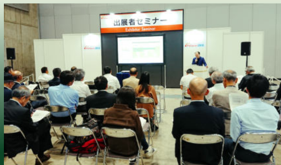
PV Japan セミナー (2018. 6. 21 イベント)