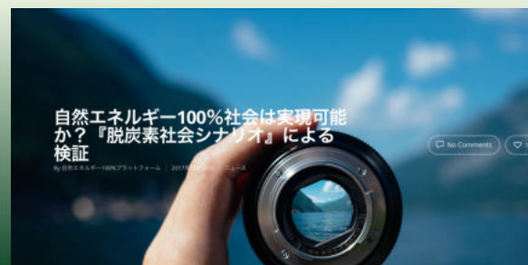
自然エネルギー100%社会は実現可能 か？『脱炭素社会シナリオ』による検 証 (2017. 10. 26 記事)