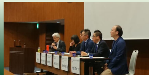
変わる世界と日本の動向 ～北海道の可能性～ (2019. 10. 8 イベント)