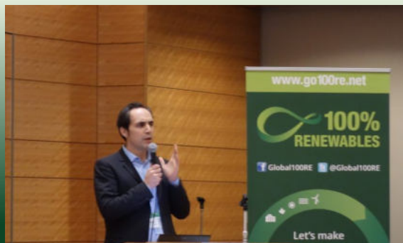
100%自然エネルギー推進円卓会議 (2017. 3. 10 イベント)