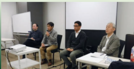
宮城で自然エネルギーを広めるには？ (2019. 1. 26 イベント)