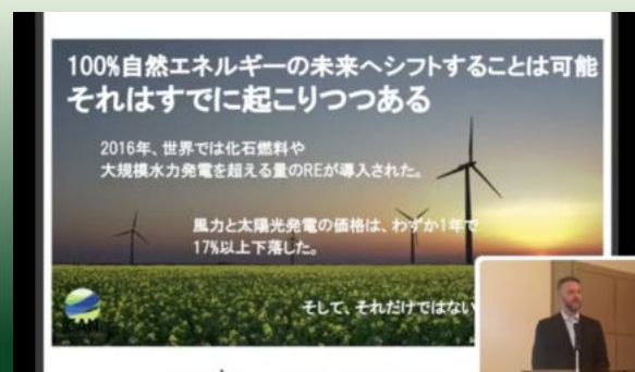
動き出す100%自然エネルギーイニシアティブ (2017. 9. 6 イベント)