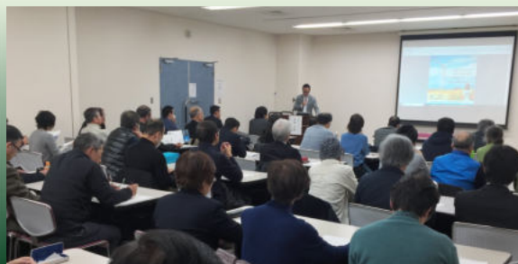
自然エネルギー100%の社会を目指して (2019. 2. 16 イベント)